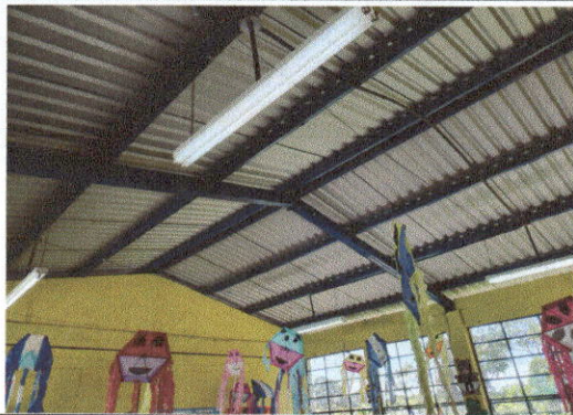
Foto 9: Reparación sistema eléctrico en módulos de aulas No. 1 y 2