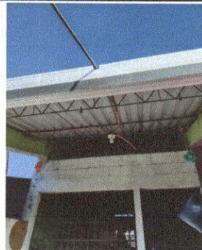
Foto 11: Reparación de cableado eléctrico en módulos de aulas No. 1 y 2