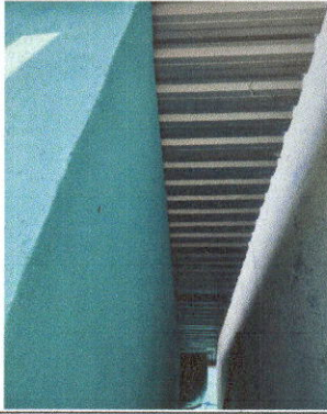
Foto 1: Sustitución de lámina, por lámina troquelada aluzinc calibre 26 en la Dirección