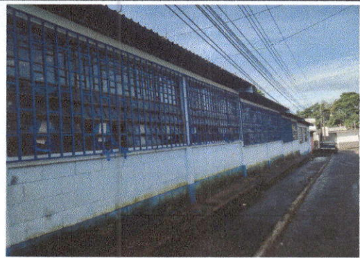
Foto 4: Sustitución de balcones de metal en módulo de aulas No. 1