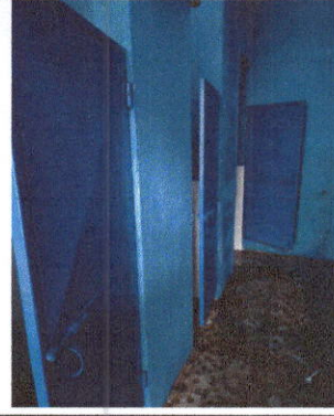
Foto 2: Mantenimiento a estructura (lijado, cambio de tubo, cepillado, sujeciones, aplicación de pintura) en módulos de baños