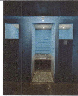
Foto 10: Sustrucción de focos ahorradores en Módulos de aulas No. 1 y 2